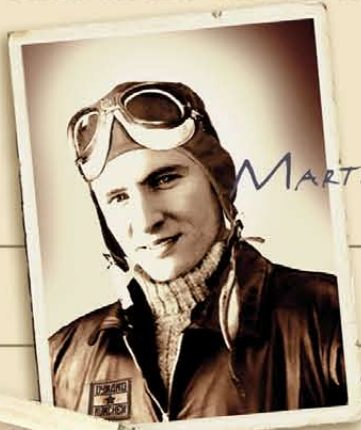
MARTIN GLÜCK Grafik & Design